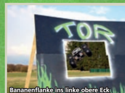
Bananenflanke ins linke obere Eck