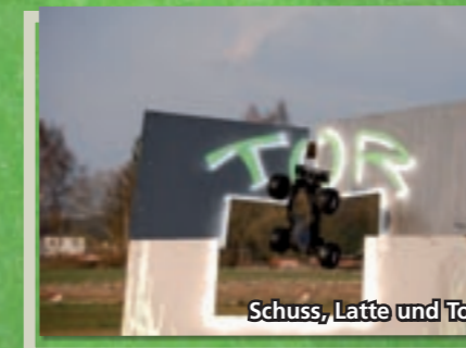
Schuss, Latte und Tor

Bashen ist eine multifunktionale Sportart. Wir fliegen nicht nur von Skischanzen, sondern fahren jetzt auch mal den heiligen Rasen platt. Wir wären nicht die Hardcore Bash Crew, wenn wir unser motorisiertes Leder in die Sicherheit eines weichen Tornetzes spielen wollten. Nein, mal eben in Tooltime-Manier eine Torwand gebastelt, damit's auch richtig kracht. Und schon erklärt sich die Vorgehensweise von allein: die Abschussrampe ganz weit ins Abseits stellen und versuchen, eine punktgenauen Elfmeter zu landen. Der Torschützenkönig: Tamiya Nitrage. Mit aggressiven Sprints beißt er sich durch das Spielfeld und schafft die weitesten Flanken – obwohl er während der Trainingsphase schon harte Fouls und noch härtere „Latten-treffer“ kassierte. Allen Kommentatoren und Spielbeobachtern, die, wie Tante Käthe schon sagte, einfach nur gemütlich im Stuhl sitzen und ein paar Weizenbier trinken, sei gesagt: Es ist wie im wahren Leben. Nur, weil das Tor groß aussieht, heißt das nicht, dass es einfach ist, es auch zu treffen! Schon gar nicht aus weit über 11 Meter Entfernung! Probiert's einfach aus!