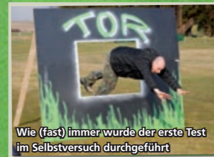
Wie (fast) immer wurde der erste Test im Selbstversuch durchgeführt