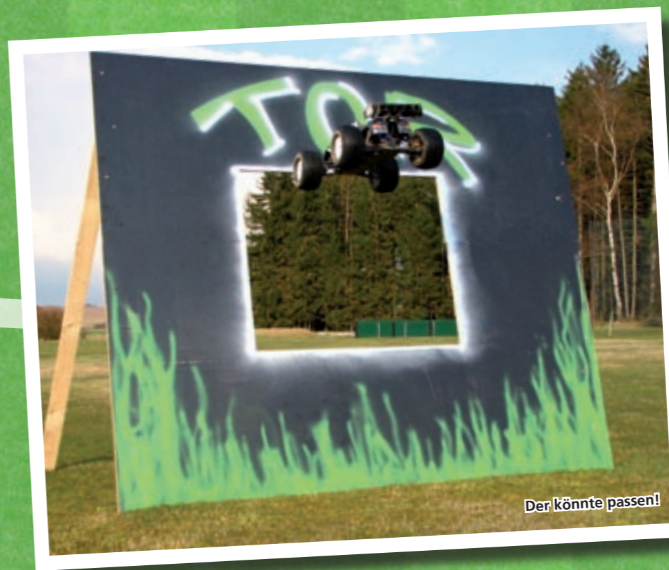
Der könnte passen!