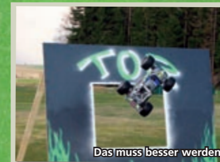
Das muss besser werden!